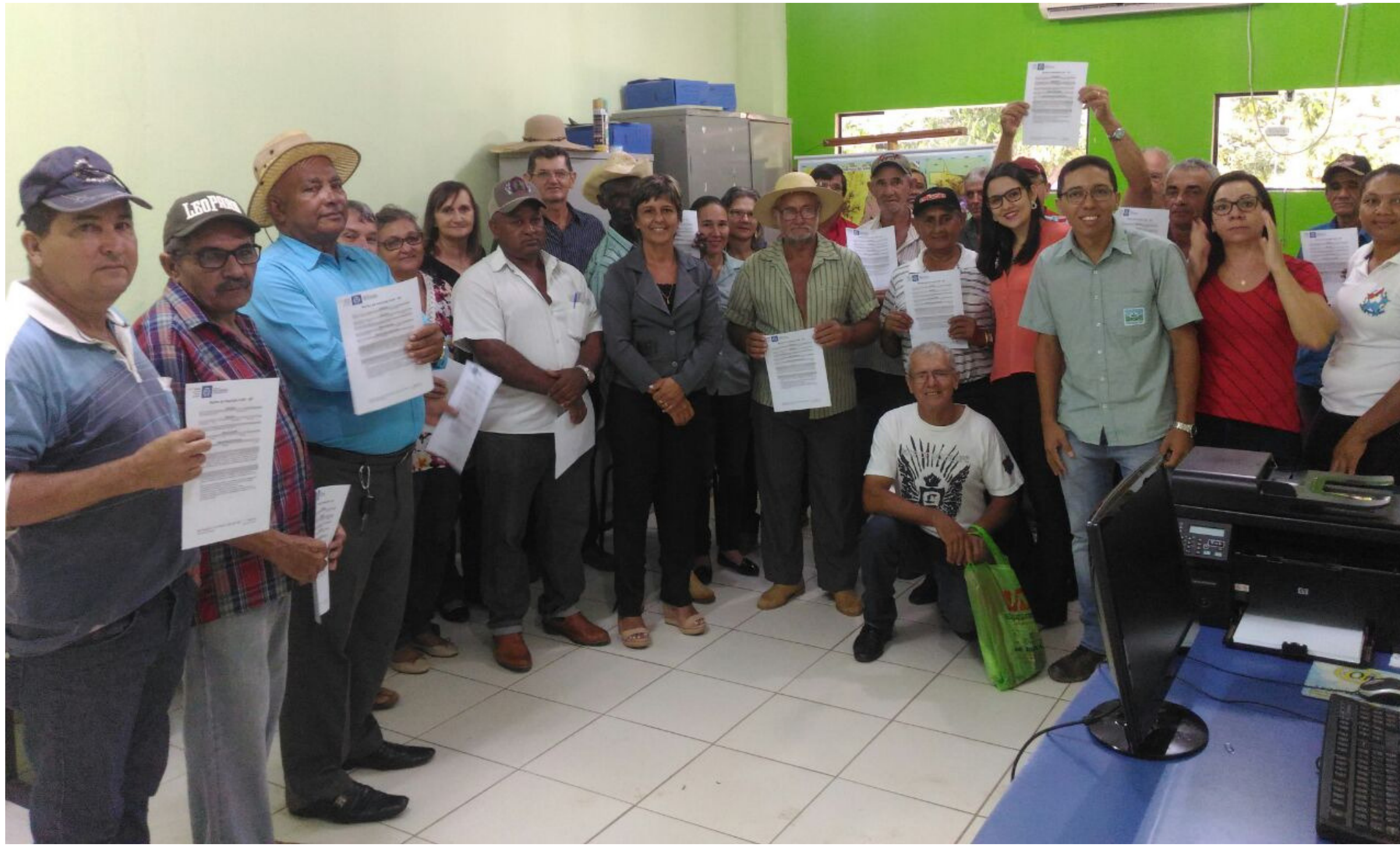
Foto: Entrega dos recibos de inscrição no SIMCAR no município de Carlinda - MT

O Instituto Centro de Vida (ICV), a Secretaria de Estado do Meio Ambiente (Sema/MT) e as prefeituras de Alta Floresta, Carlinda e Paranaíta estão promovendo uma força-tarefa para implementação do Código Florestal.