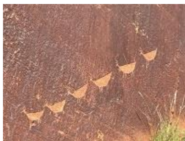
Local sagrado na beira do rio Colorado, com hieróglifo da nação Zuni